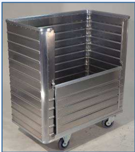
Transportwagen D 3508/1050 B mit Frontklappe geöffnet