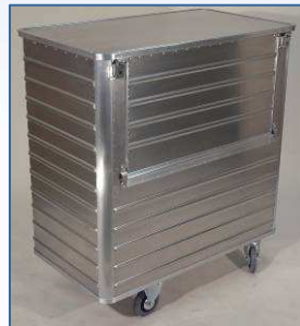
Transportwagen D 3508/1050 B mit Option: Scharnier-Deckel mit 2 Hebelspannverschlüssen