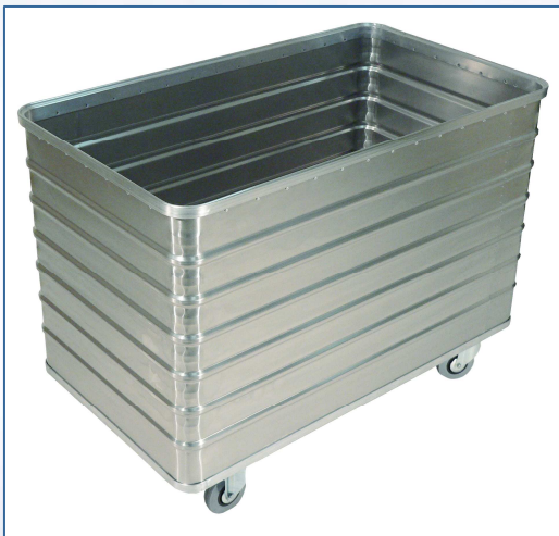
Transportwagen D 3008/656 B