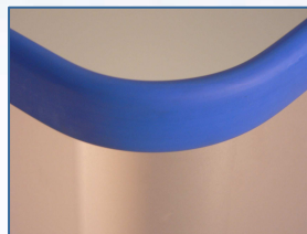
PVC-Stoßschutzpuffer am oberen Wagenrand