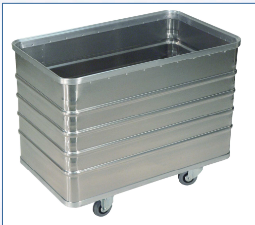
Transportwagen D 3008/330 B